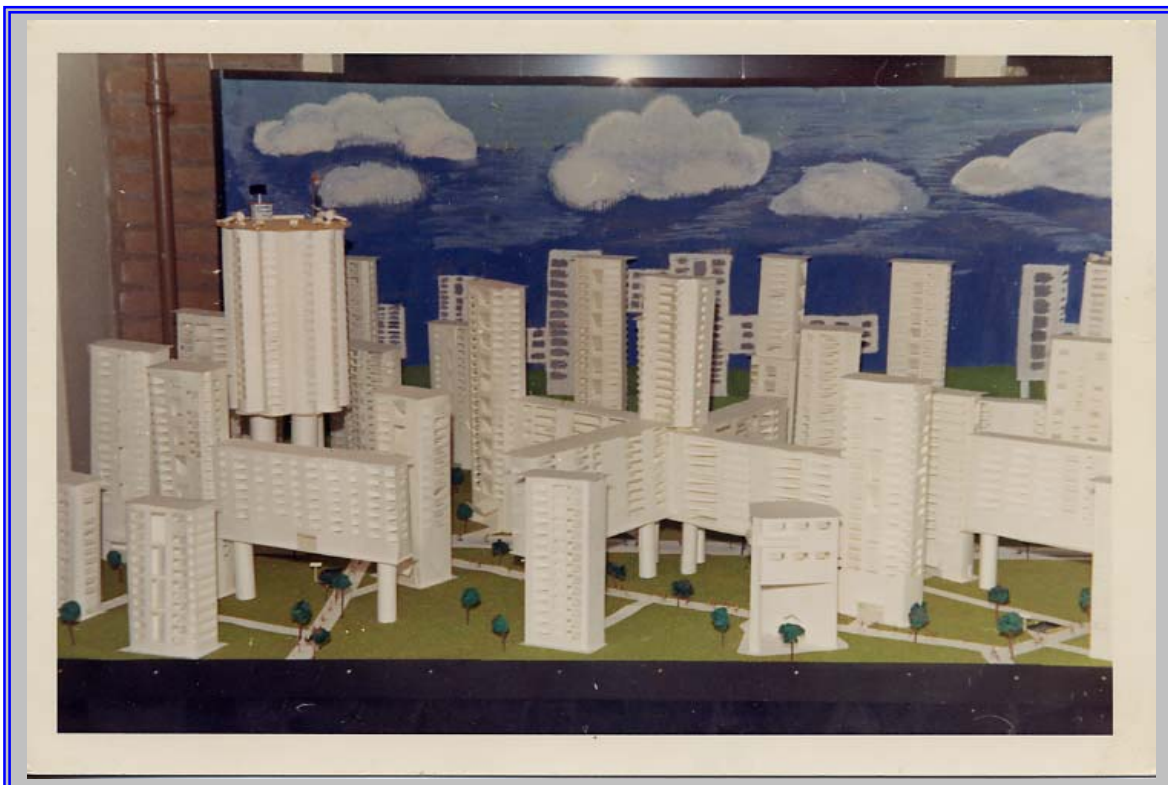
Stadswijk in het jaar 2000. Project uit de 5 e klas

Huidige stand van zaken met betrekking tot het aantal leerlingen en docenten die bekend zijn bij de redactie