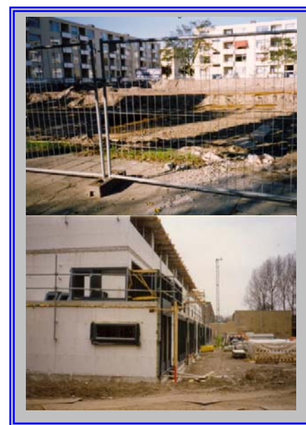
Nieuwbouw op de plaats van de Kaj Munk